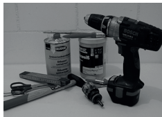
Bühnenbau: Ueli Kamm Matthias Koller